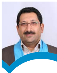
سید محمد اتابک