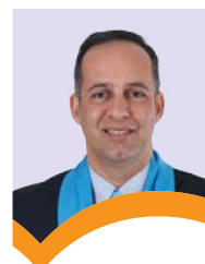
شریف نظام مافی